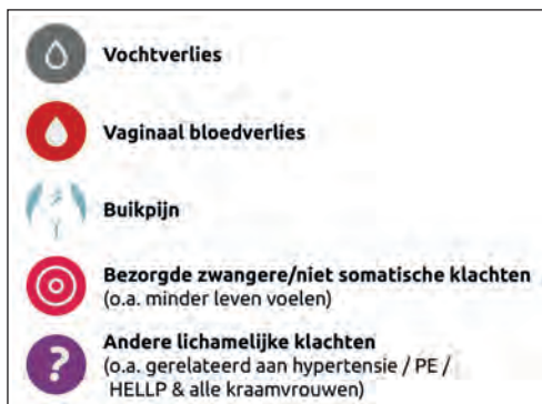
Figuur 1. Ingangsklachten NTV.

Triagesystemen worden al langere tijd gebruikt in de algemene spoedzorg (o.a. Nederlands Triage Systeem, Manchester Triage Systeem). De algemene triagesystemen zijn echter niet geschikt voor de obstetrische spoedpatiënt. Omdat er sprake is van twee patiënten, de moeder en het ongeboren kind. Bovendien presenteert de zwangere vrouw zich met andere klachten en symptomen. Voor de obstetrische spoedpatiënt zijn er de afgelopen jaren diverse triagesystemen ontwikkeld in Canada, de Verenigde Staten en Zwitserland. 1-4 In Nederland werd de afgelopen jaren het Rotterdam Obstetrisch Triage Systeem (ROTS) 5 ontwikkeld. Dit systeem is gebaseerd op fysieke triage, wat inhoudt dat het telefonische triagemoment niet is beschreven.